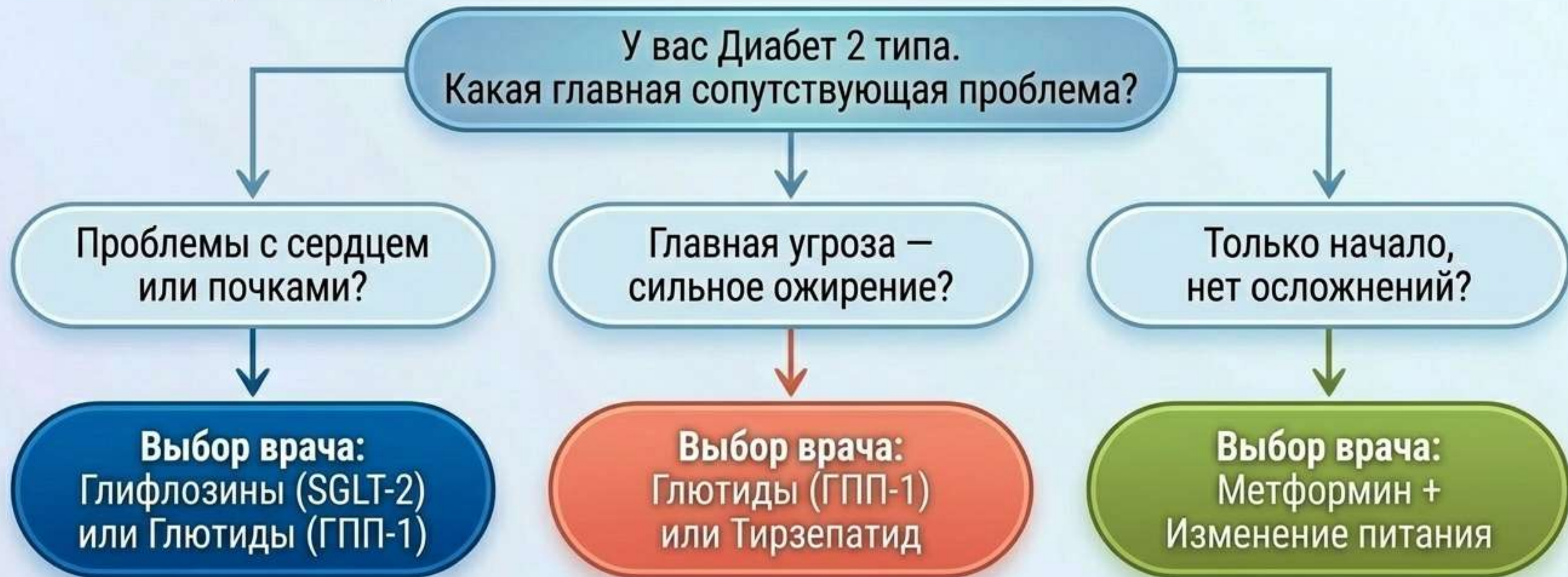
Таблица носит информационный характер и упрощает понимание. Назначение осуществляет только лечащий врач!

Нет одной «самой сильной» таблетки. Есть препарат, который идеально чинит именно вашу поломку.