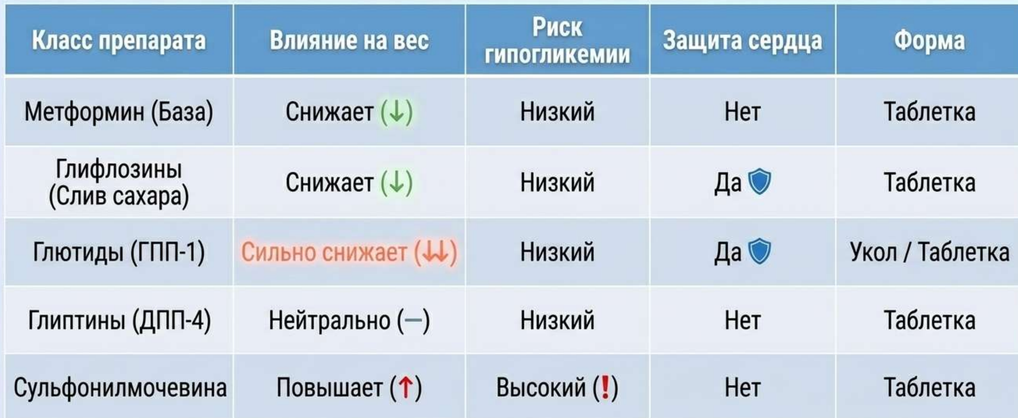
Таблица носит информационный характер и упрощает понимание. Назначение осуществляет только лечащий врач!